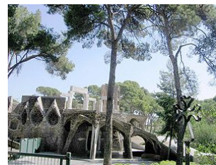
Sagrada Família, obra

Gaudí dissenyà també el mobiliari de l'interior, uns bancs amb reclinatori col·locats de forma circular entorn de l'altar major. Destaquen tanmateix les piles d'aigua beneïda, confeccionades amb grans petxines marines procedents de Filipines, que arribaven a mans de Gaudí de part del comte Güell, propietari de la Compañía Trasatlántica, que feia la ruta amb l'antiga colònia espanyola.